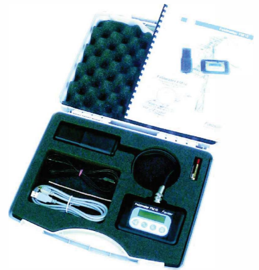
Lieferumfang Feldmeter FM10L

Der Datenlogger FM10L verfügt über 1 GByte Speicherkapazität und eine Echtzeituhr für eine genaue Zeit-/ Datumsangabe zu jedem Messwert. Das Messintervall ist zwischen 0,25 Sekunden und 1 Minute einstellbar. Der Logger verfügt über zwei Betriebsmodi: Für Langzeitmessung der Dauermodus, für räumliche Aufzeichnungen die Einzelpunktmessung. Zudem ist ein paralleles Aufzeichnen der Frequenzbereiche Bandpass 16,6 Hz und Hochpass 50 Hz möglich. Das Auslesen der gespeicherten Messwerte und die übersichtliche Einstellung der FM10-Funktionen am PC erfolgt über eine schnelle USB-Schnittstelle. Zur Bearbeitung und Dokumentation der aufgezeichneten Messwerte dient die funktionelle Software FM-Data.