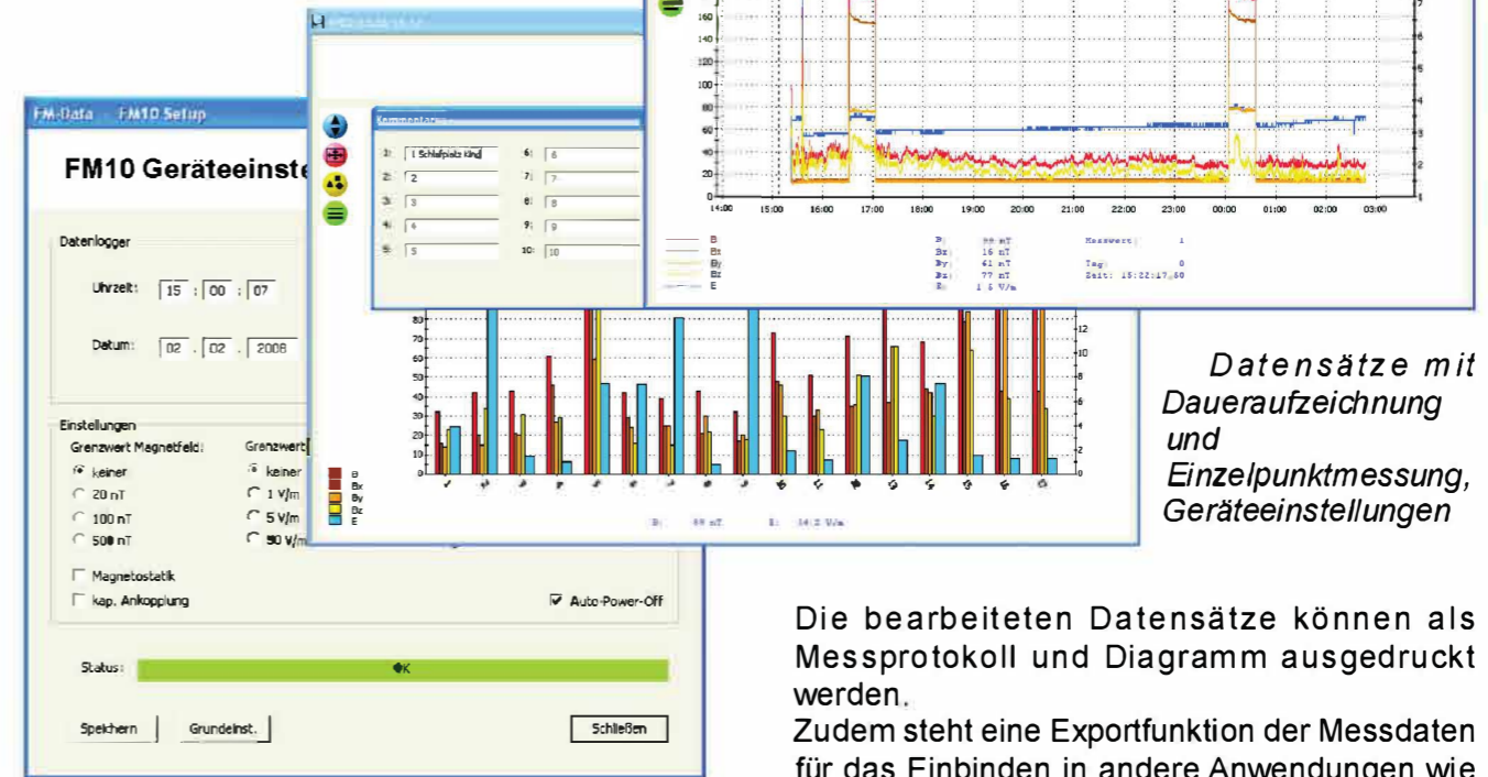
Datensätze mit Daueraufzeichnung und Einzelpunktmessung, Geräteeinstellungen

Dieses Programm wird ständig weiterentwickelt und an die Kundenwünsche angepasst. Dieser Service steht Ihnen in Form von kostenlosen Updates jederzeit zur Verfügung!